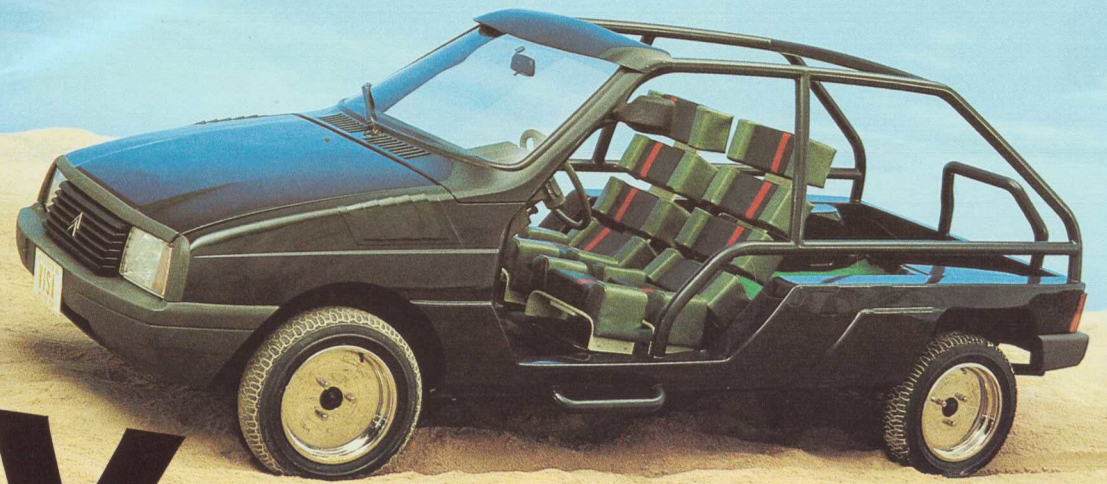
VISA. Transformation effectuée à partir d'une Visa GT.