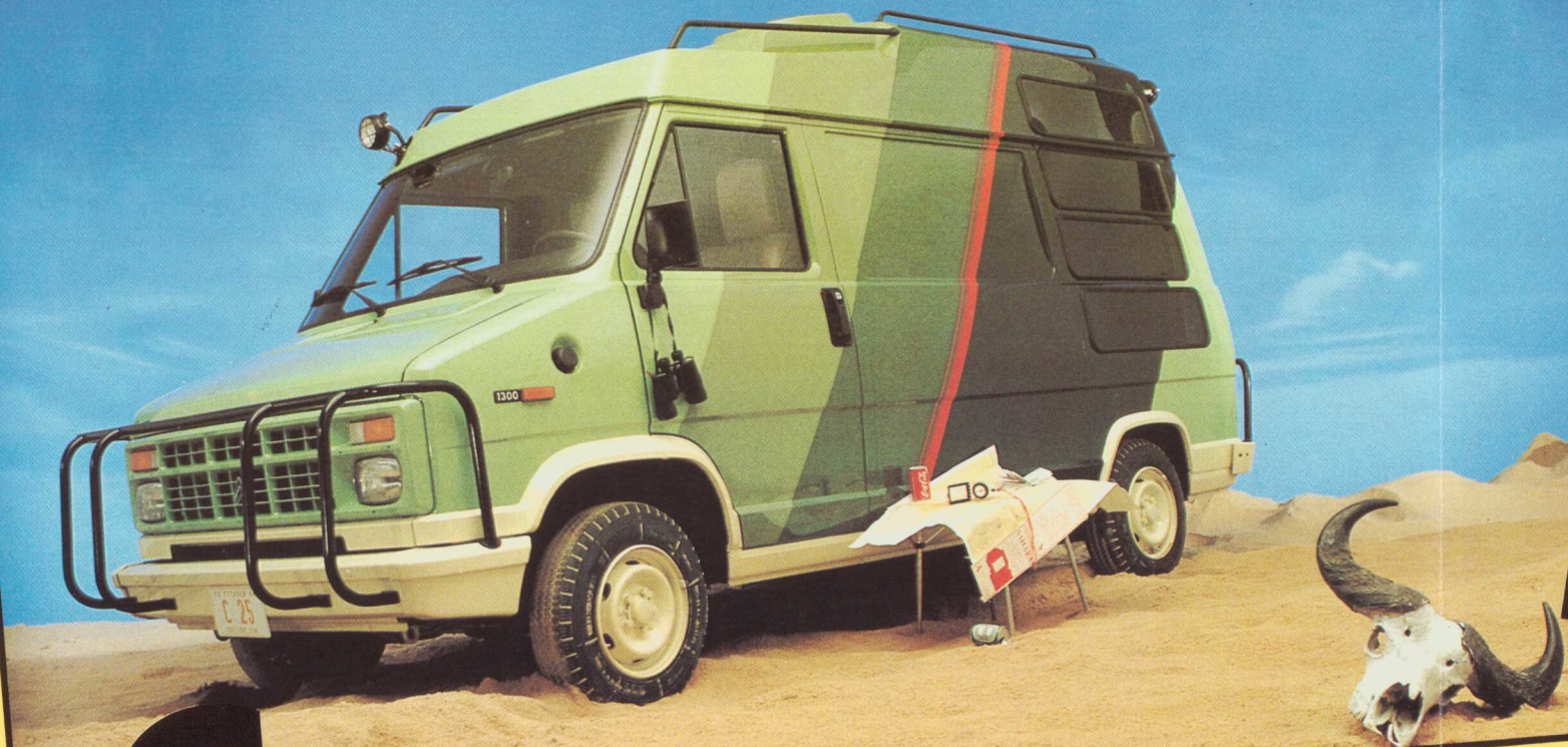
C25. Aménagement réalisé sur la base d'un C25 D Fourgon destiné aux grands reportages.