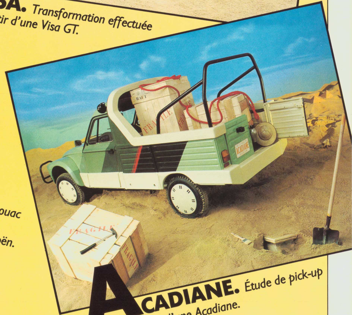
ACADIANE. Étude de pick-up réalisée à partir d'une Acadiane.